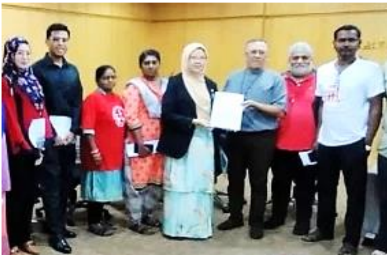
JPKK & KESATUAN PEKERJA SWASTA DI HOSPITAL Membawa Isu Pekerja Kontrak Kerajaan kepada Menteri Kesihatan YB Zaliha Mustafa