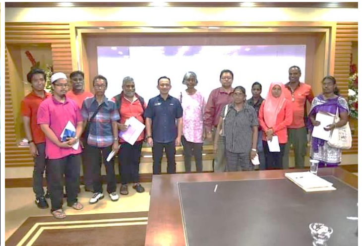
JPKK berjumpa dengan YB Menteri Pendidikan Dr Mazlee Malek (Jan 2020)